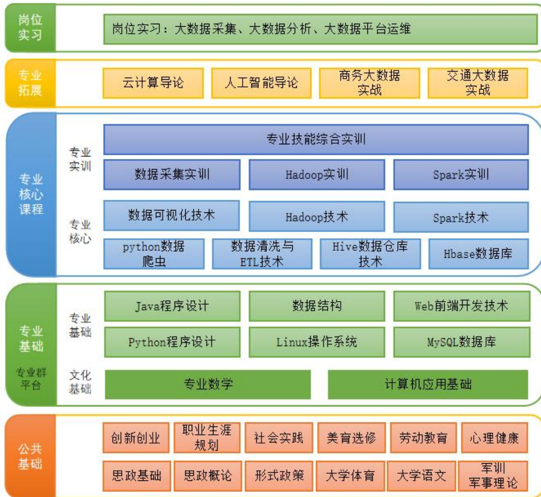
图 2 计算机应用技术专业课程结构图

公共基础课程、专业基础课程、专业核心课程、集中实践课程、专业选修（拓展）课程、公共选修课程的课程体系分别如表 3-表 8 所示：