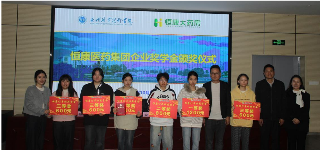
图 2 颁发企业奖学金