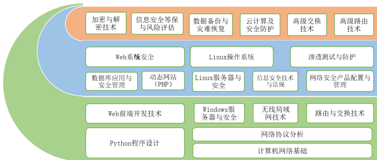
图 2 课程结构图

本专业课程以工作岗位的职业能力为依据进行分析与设计，依据各岗位的特殊性分别设计其对应的核心课程，同时结合职业发展方向设计专业拓展课程。